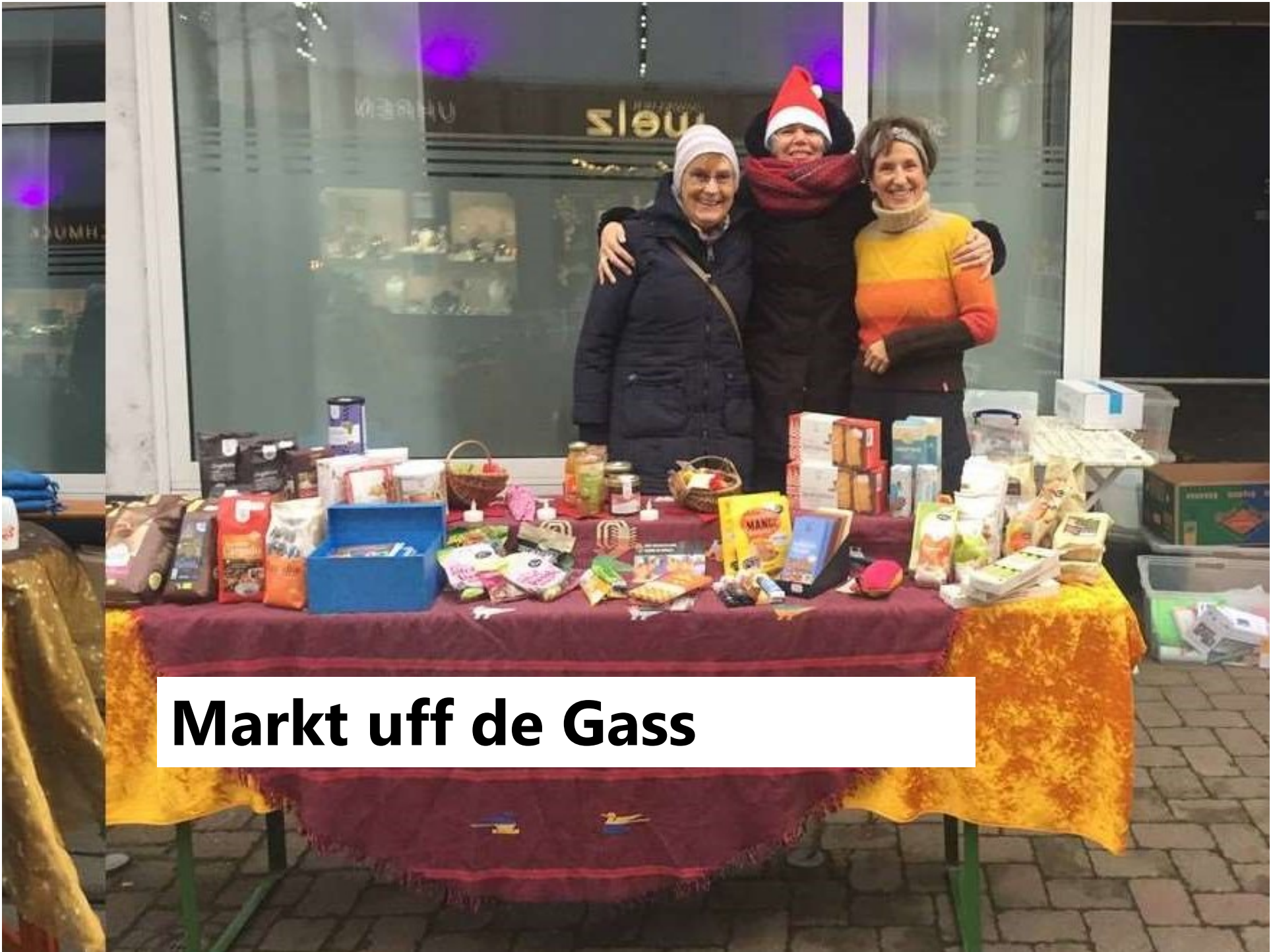
Markt uff de Gass